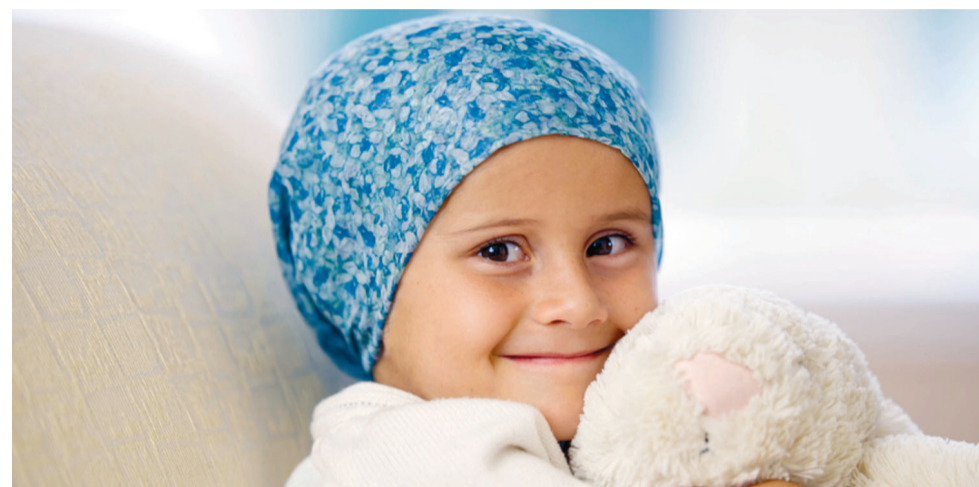
Oferecer ferramentas às famílias que lidam diariamente com o cancro é um objectivo do evento

«Além do maravilhoso contributo dos profissionais da área vamos contar com a presença de sobreviventes de cancro infantil e familiares que irão partilhar os seus testemunhos e histórias», explica a responsável da fundação, sublinhando que